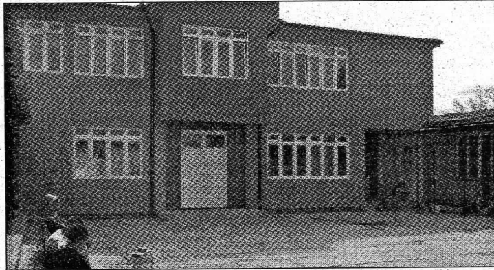
ДОМ Објект Високе технолошке школе струковних студија